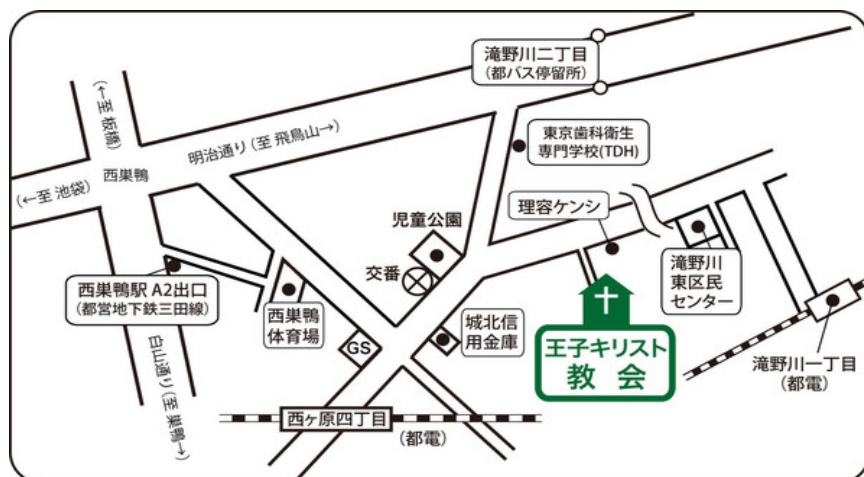
<王子教会周辺地図>

自分の人生に漠然とした不安を感じたことはありませんか？ もしそのように感じたことがありましたら、是非教会に来て、先入観を持たずにイエス・キリストを信じてみてください。そうすれば必ず、 主なる神はあなたの道を確かなものとしてくださいます 。そして主ご自身も、そのことを大変喜ばれます。主はあなたの人生を、その歩みを、 確かなものになりたいと願って おられます。